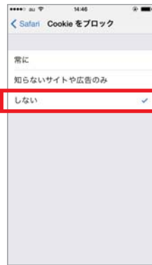
④「しない」に設定します。