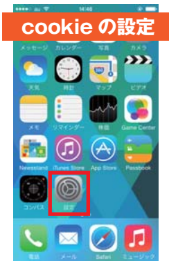
①「設定」をタップします。

ご参加の前に①クッキー (cookie) ※1 の設定を「しない」の設定になっているかどうかご確認ください。「知らないサイトや広告のみ」又は「常に」の設定になっておりますとスタンプ情報を保持することが出来ません。次に②プライベートブラウズ ※2 の設定は「OFF」の状態になっているかご確認ください。※下記は iPhone7 での設定方法です。