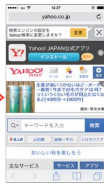
⑤「プライベートブラウズ」が「OFF」になり、上下の枠が白く変わります。