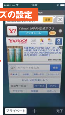
②白枠の「プライベート」をタップします。