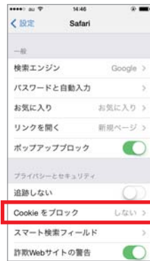
③「Cookieをブロック」をタップします。