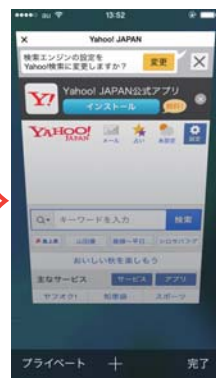
④「プライベート」の白枠が無くなったことを確認ください。